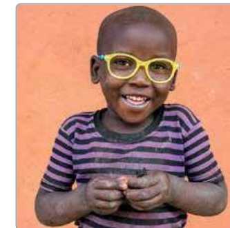
Dopasowanie do wady wzroku